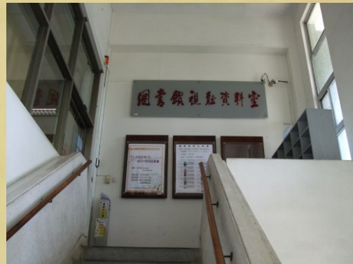
位於舊圖書館二樓的圖書視聽資料室，內有豐富的影音資料可供同學借閱

在 1994 年，學校在舊圖書館 2 樓闢建「視聽圖書室」，在當時高等教育經費相對比較充裕的黃金時期，中大視聽圖書室內，提供學生十分優越的影音播放環境，數量眾多的藝術電影卡帶及影音光碟，以及多座個人視聽設備，和小型團體視聽室，為熱愛語言學習以及藝術電影的學生們，提供了視聽學習與觀賞電影的好去處。有別於「大禮堂」的電影播放，利用視聽圖資源的觀賞者，在單獨面對影音播放的氣氛下，對電影產生了不同於電影院群眾觀賞的詮釋方式，也接間促成中大的電影播放文化，從大眾的，集體式的聯誼性活動，漸次轉變為愛好者個人的小眾活動。