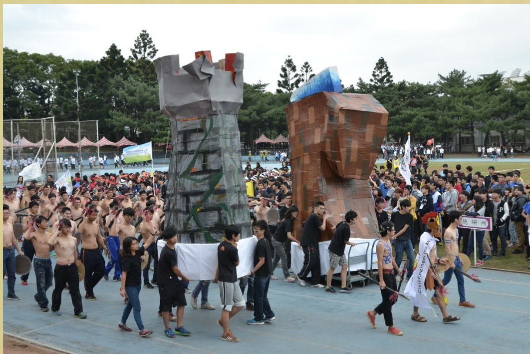
依仁堂新建後的運動會，其 PU 藍色跑道已成為學生展演的另類舞台，土木系 2014 運動會榮獲「最佳主題獎」

在整個 1980 年代裡，中大致力於校園建設並跨領域整合的研究基礎，此時期學校擴大了學生活動空間，將「據德樓」和「游藝館」闢設為學生社團據點，並且興建體育館(依仁堂、游泳池)，開發志希館、男九舍，使學生自原有的活動空間，由男一舍、宵夜街，默默遷往今日九舍一帶，學生也開始在依仁堂或運動場上舉辦舞蹈類的戶外演出。此外，學校在成立管理學院的同時，也設置了校園內第一座公共藝術品「太極」，成為當時校園景觀的新地標。