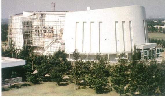
1981 年大禮堂（今教學研究大樓原址）落成啟用，為學生提供藝文傳播展演的空間