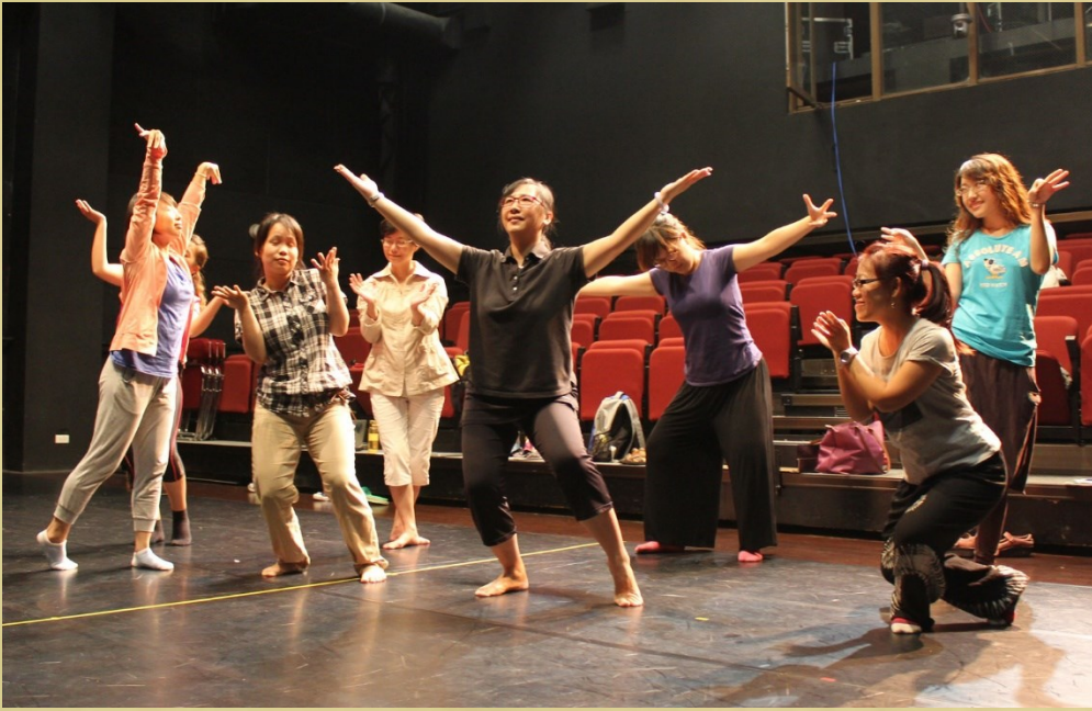
黑盒子劇場，中大學生可於此場地排練

無限可能，這是一個甫一開始便以開放姿態模糊掉展演空間的舞台，不同於過去學生話劇公演的經營形態，他們重視戲劇的呈現，以及劇團的經營體驗。