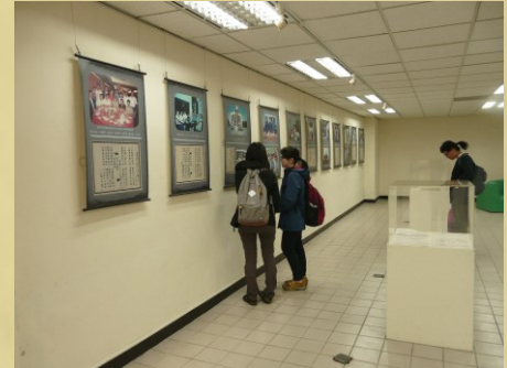
中大總圖書館地下室特展空間

落成於 1994 年的「總圖書館」位於學校行政大樓與中正圖書館（舊圖書館）之間，採用新式管理方式，佐以資訊科技，統整全校圖書資源，涵蓋平面圖書與國際電子期刊，全館分為地下一層及地上八層，設有閱覽席位計一千餘席，「公用研究室」十餘間，於公共閱覽空間中，點綴綠意美化環境，拉近圖書館與讀者的距離，使知識傳播融入於生活之中。其地下一層的「藝文走廊」可供藝文展示，曾舉行新書發表會、攝影展、書法展、畫展等，既是全校圖書典藏與流通的知識殿堂，也是中大藝文展演重鎮之一。