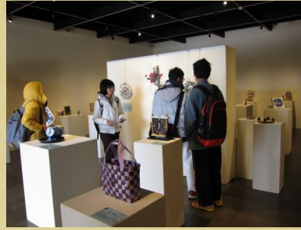
藝文中心舉辦「日日好時」特展

1990 年代，學校成立藝文中心，為中大的藝文圈直接挹注資源。在藝文中心的推展下，校內開始出現越來越多的校外藝文活動，包含攝影、書法、繪畫、泥雕藝術等靜態展出，以及雲門舞集、相聲瓦舍、音樂團體等演藝活動，藝文中心每年推出許多檔展覽及表演節目，並不定期舉辦校外藝術參訪及各期推廣教育課程，包括繪畫、素描等課程，致力提升校內藝文素養，帶動校園藝術風氣，打破了早期校園藝術的藩籬，重塑中大的藝文展演生態，為中大師生的藝文展演，注入更多元化的創意與發展資源，在多年的經營下，藝文中心既是中大校園藝術活動的主導者，亦是桃園地區藝文活動展出據點之一。