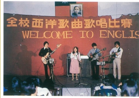
1980 年在秉文堂歌唱比賽及話劇比賽