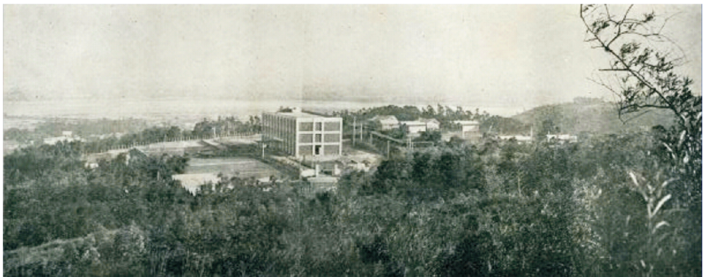
▲1963年苗栗二平山校區全景鳥瞰圖

一九六三年，苗栗校地完工，九月地球物理研究所正式遷入，乃臺灣當時第一個地球物理研究所。草創期因校區地處偏僻，師資難以延攬，圖書儀器短缺，研究學習過程相當艱辛。但也造就日後不少優秀地球物理學家，促使中大地球物理所聲望水漲船高。