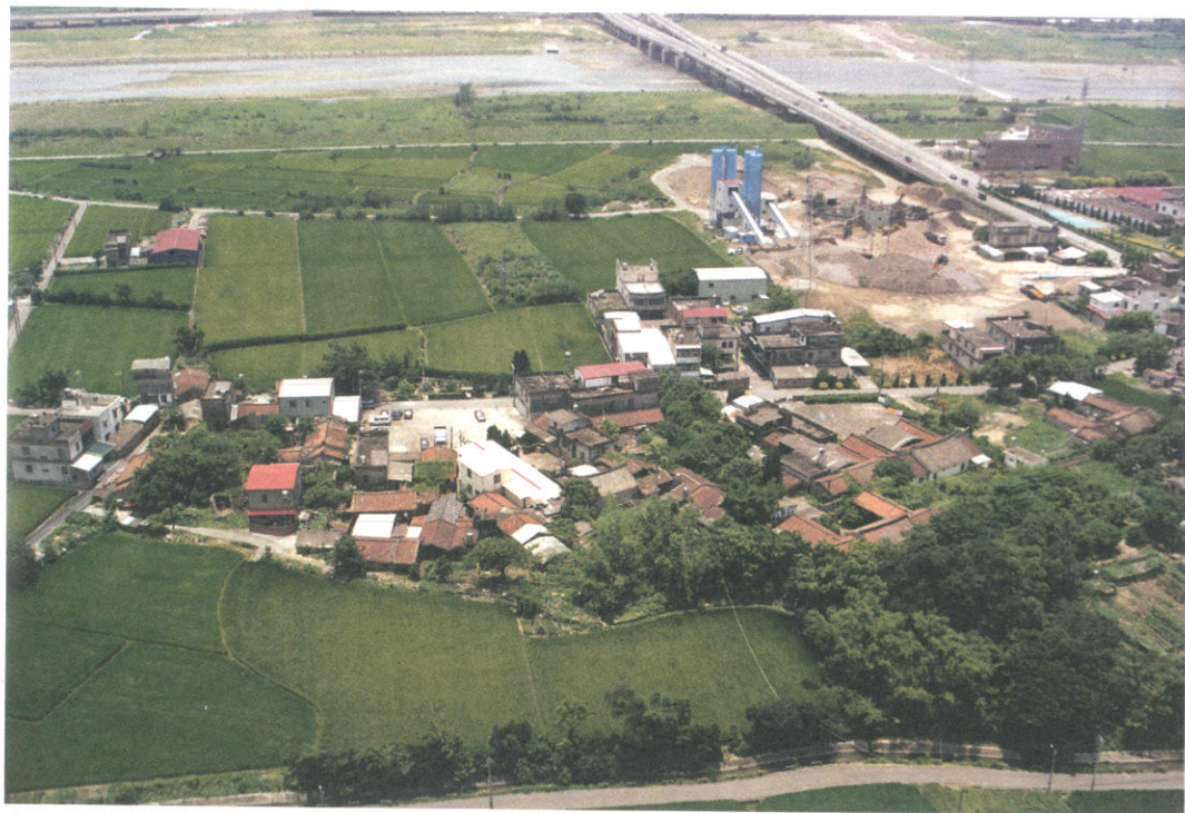
竹北六家林氏聚落空拍圖

本書文獻的分類依黃卓權與本人合編的《古文書的解讀與研究》〈民間私藏古文書分類表〉加以分類。契字中的俗（異）體字，也依上引書〈正、俗（異）體字對照表〉，直接寫成正體字，不再將俗（異）體字併列。對於年代數字也加以統一，如契字中的「嘉慶貳拾年十月」，直接書寫成「嘉慶二十年十月」，以方便讀者閱讀。