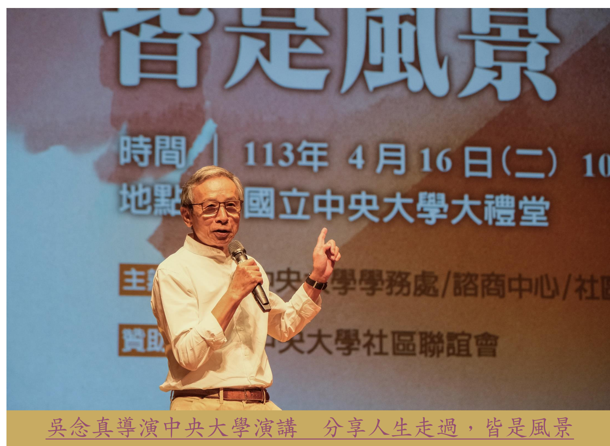
吳念真導演中央大學演講 分享人生走過，皆是風景