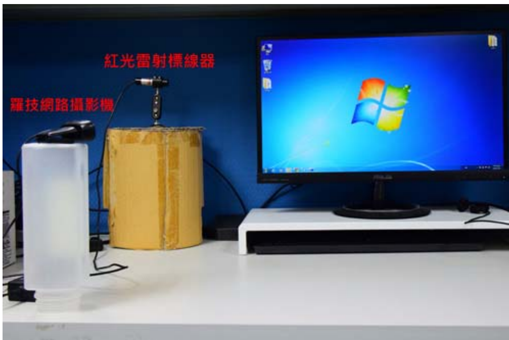
僅需電腦螢幕、視訊網路攝影機、紅光雷射標線器就能享受大屏幕光學式螢幕觸控技術。