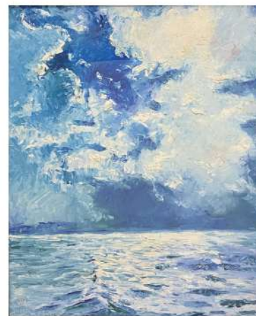
大海澎湃 1995 50×40cm