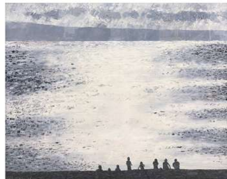
觀海 2024 53×65cm