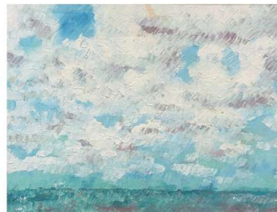
雲 2011 36×45cm