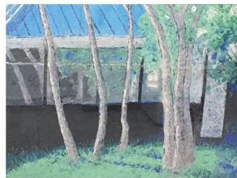
光與影 2024 50×60cm