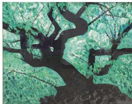
湖邊 2024 53×65cm