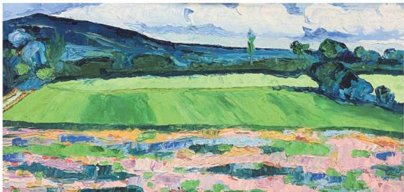
給「荔枝」咬去一角的風景畫 1990 30×60cm

但我喜歡比我大十歲的既是藝術家又是歷史學家兼哲學家的霍克尼的另一個原因，是他的談論中往往含有哲理。例如他說：別把成功當作目標，你越是一心追求它，越無法得到它。因為成功和快樂一樣，是求不來的，只能接着什麼而來；他又說：因為畫畫的時候，你會專心到渾然忘我的地步。人一旦可以抽離自己，能夠經歷的時間就會增加了(見大衛·霍克尼及馬丁·蓋福特，「春天終將來臨」)。大家想想這是不是和科學研究並無兩樣？