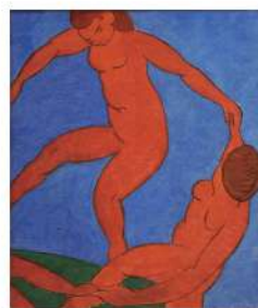
臨摹馬諦斯 1987 30×24cm

因為沒有上過繪畫課，我是先從臨摹一些名家的作品開始。選擇條件是一方面我喜歡，另一方面是要簡單。譬如說馬諦斯 (Henri Matisse)和霍普 (Edward Hopper)都是我喜歡的畫家。我也臨摹過凡·高(Vincent van Gogh)的向日葵等，但都不見了。事實上，我初學時還有一個助手。在當時女兒們養了一只叫做「荔枝」的白兔，它住的籠子便是放在我畫室對面的房間，這也是我放畫板的地方。有時候「荔枝」從籠子跑出來東咬西咬，結果是把一幅風景畫咬了一角。我只好順勢把這幅畫切成上下兩半。我學畫畫的經過可以說是得道多助了！