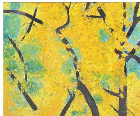
盛夏 ( ) 50×60cm