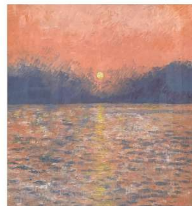
日出 2010 56×51cm