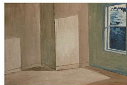
臨摹霍普 1988 30×40cm

因為要省去洗筆的麻煩，我在開始嘗試油畫不久便不再用畫筆而改用畫刀，這當然也限制了筆觸的線條和力道了。事實上我有很多地方都是不按牌理出牌的。但因為純是興趣所在，所以也沒有辦法去改進。由於日常工作的緣故，我以前習慣了在夜間作畫，12F大小的畫從起筆到完成大概是4-5小時之間，所以不免總會顯得粗枝大葉。此外，我臨摹的作風不改，但方法是把自己拍照的影像(或者其它圖片)當範本，所以不知不覺間亦影響了透視的角度。本來覺得人生便是如此，但在約七、八年前注意到著名畫家霍克尼(David Hockney)發表他對16世紀荷蘭天才畫家維梅爾 (Johannes Vermeer) 精確得不得了的畫作的詮釋，說維梅爾是利用照箱機技術才創作出這些傳世之作。而霍克尼本人也身體力行，拼集照片製作了一些大得不能更大的風景畫。我想到自己的繪筆方式和這些各領風騷數百年的大師可能有一丁點相似，有時也會莫明其妙的高興起來。