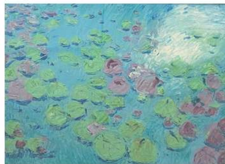
夏荷 2007 34×44cm