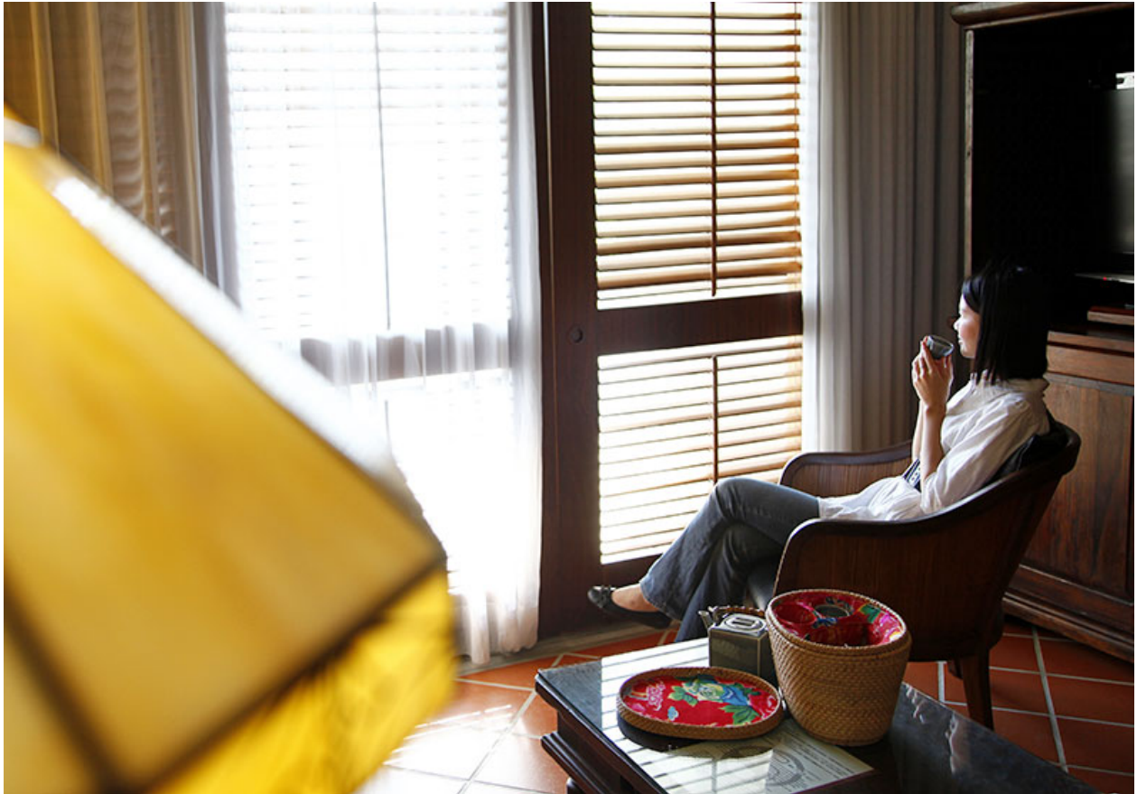
圖 / 從探尋熱情出發，做好人生第一次生涯決定。