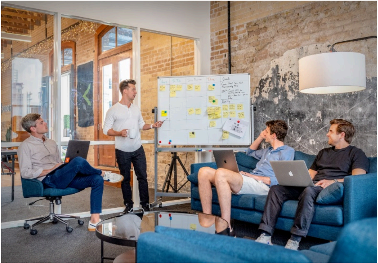
圖 / 不一定每個人都要追求高薪，還是要看每個人對自己生活與成就感的定義。

此外，今年在排名變化上，雖然台成清交始終占有一席之地，但國立大學方面，中央大學今年都擠進三大學群前五名，私立大學中，中原大學也表現亮眼，雖未名列前五名，但在三大學群都超越過去表現良好的老牌私立學校；尤其去年新生報到率，相較於其他私校缺額嚴重，中原卻是百分之百報到率。