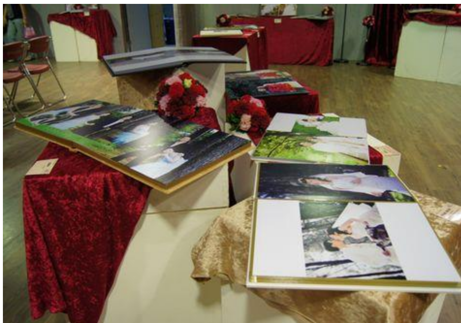
展出的浪漫婚紗照中，也訴說著每對佳偶的愛情故事。