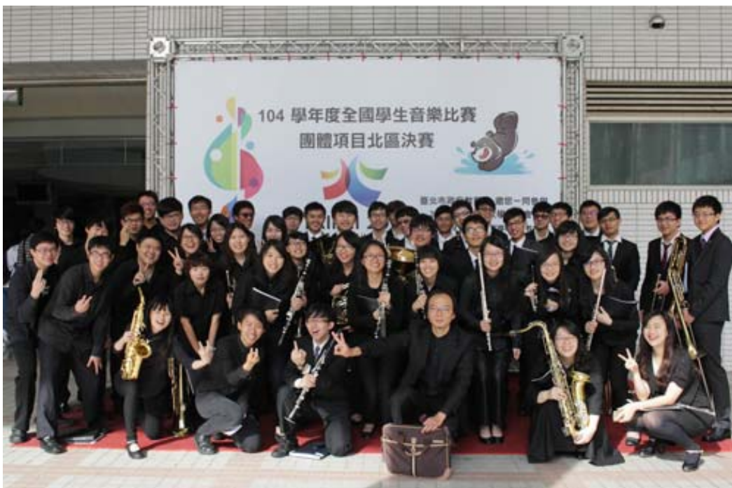
中央大學管樂社參加104學年度全國學生音樂比賽榮獲「管樂合奏特優」、「銅管五重奏特

管樂社將於4月28日舉辦室內樂演奏會「音詩錄」及6月2日舉辦期末成果發表會「旅行的意義」，歡迎校內外對管樂有興趣的聽眾齊赴中央大學大講堂欣賞精彩演出，感受管樂風情。